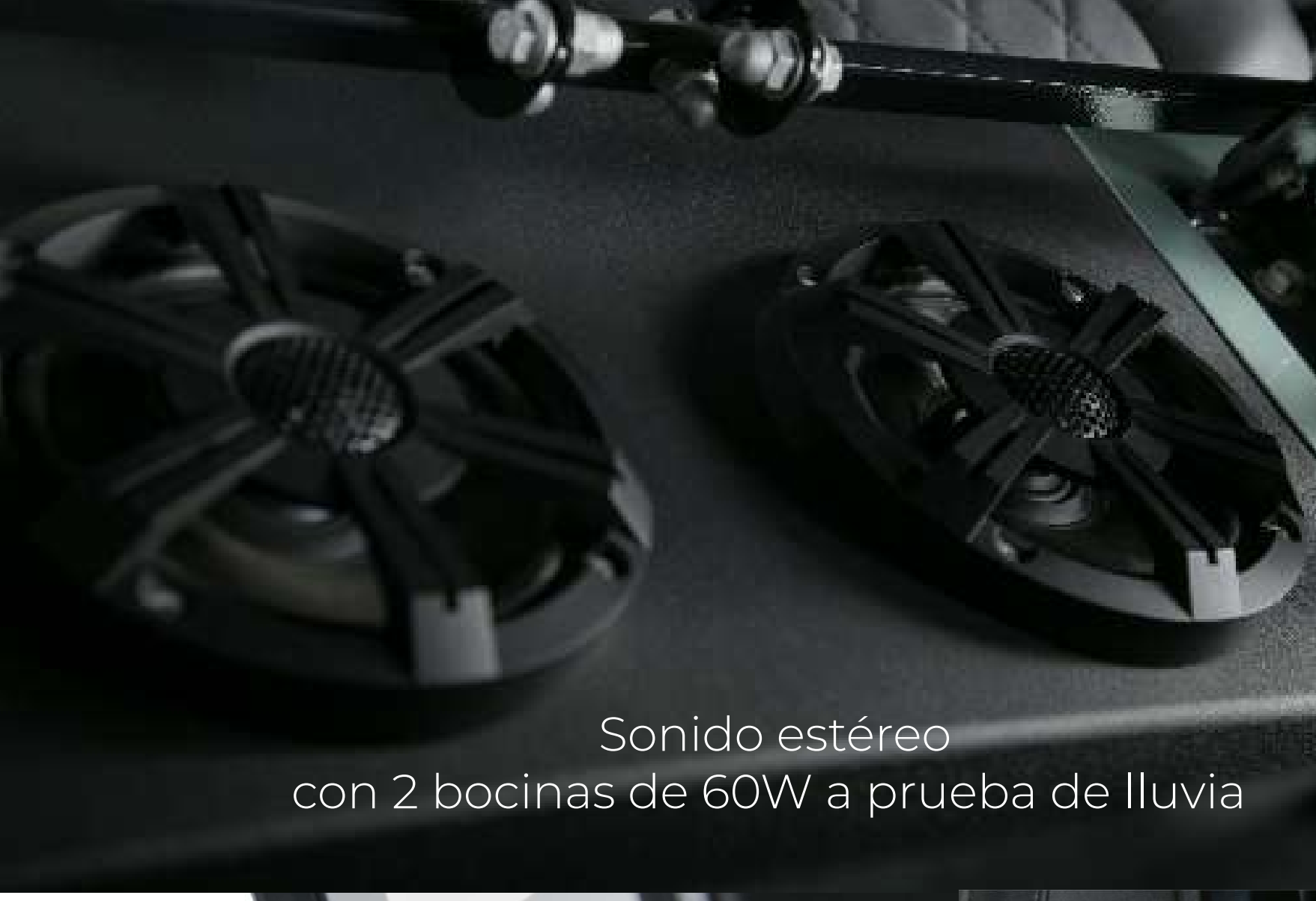
Sonido estéreo con 2 bocinas de 60W a prueba de lluvia