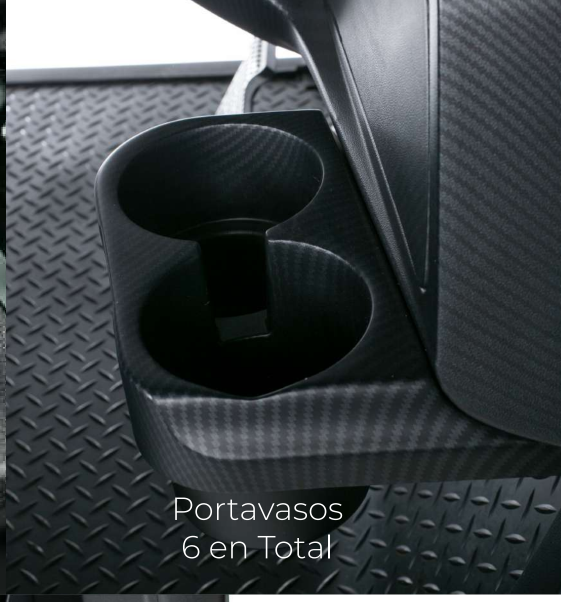
Portavasos 6 en Total